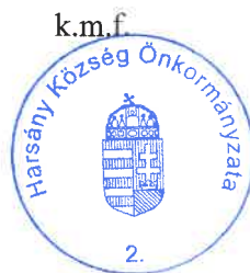
Hazadiné Szilvási Mária polgármester