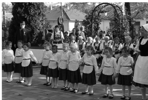
Kisvakond csoportos lányok