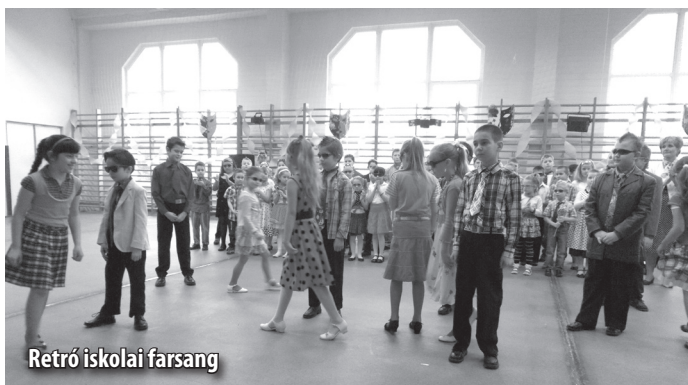
Retro iskolai farsang