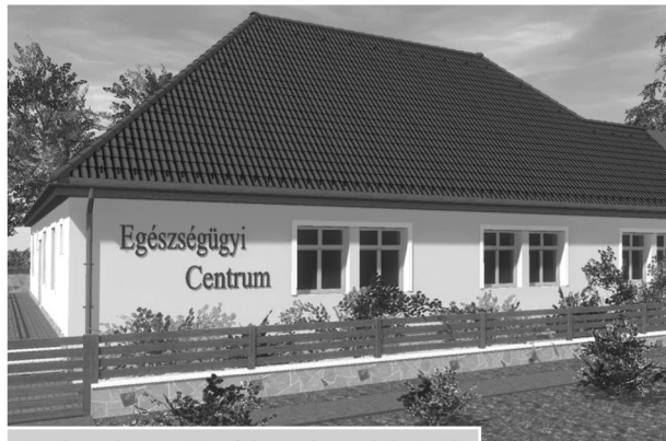
Modern, korszerűen felszerelt rendelő épül

Mintegy 60 millió forintból újul meg a harsányi orvosi rendelő. Az önkormányzat által benyújtott Európai Uniósi pályázat pozitív elbírálásáról a napokban értesítették községünk vezetőit. A beruházás eredményeként teljesen átalakul az épület. Az alapterülete 30 m 2 -rel nő, emellett átalakul a belső szerkezete is. A mai kor igényeinek megfelelő orvosi, fogorvosi, védőnői rendelőket alakítanak ki, tágas váróteremmel. A fejlesztés során nyílászárócseré, tetőcsere, külső szigetelés, valamint eszközbeszerzés is megvalósul. „Az orvosi rendelő helyén hamarosan egy új, 21. századi, európai szintű Egészségügyi Centrum várja a harsányiakat. Nagy öröm számomra, hogy ezen beruházás megvalósulása után elmondhatjuk, hogy településünkön 2010. óta az összes közintézmény (iskola, óvoda, Polgármesteri Hivatal, Községi Ház, orvosi rendelő) külsőleg-belsőleg megújult. Külső szigeteléssel, műanyag nyílászárókkal, korszerű, energiatakarékos fűtési rendszerrel, felújított belső térrel, új burkolatokkal, belső nyílászárókkal, modern eszközökkel szereltük fel.” – mondta el Szabó Gergely, Harsány polgármestere. HT