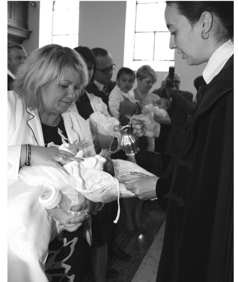
Nevelőszülők és gyermekek együtt ünnepeltek településünkön

BEFOGADÓ SZERETET Kedves nevelőszülők és keresztülők, ezek a kicsinyek egy dolgot nagyon is értenek, amikor a befogadó szeretet nyelvén beszéltek. Tudom, nehéz a szívetek, sok kérdés van: meddig vannak rátok bízva, hova kerülnek? Hogyan tudjátok teljesíteni a keresztelési fogadalmat: úgy nevelni őket, hogy vallást akarjanak tenni Krisztusról, hozzá akarjanak tartozni?