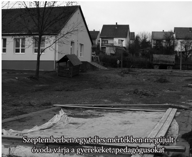
Szeptemberben egy teljes mértékben megújult óvoda várja a gyerekeket, pedagógusokat

A hagyományos közmunkaprogram mellett több munkahelyteremtő pályázatot is benyújtott önkormányzatunk. Második ízben nyertünk jelentős forrást a szociális földmunkaprogramra, melynek keretében jelenleg 13 főt foglalkoztatunk. Másik két győztes pályázat eredményeként a Startmunka programban 35 fő, a kazánprogramban pedig 2 fő dolgozik. A hagyományos közmunkaprogrammal