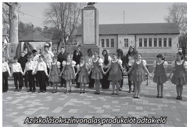
Az iskolások színvonalas produkciót adtak elő