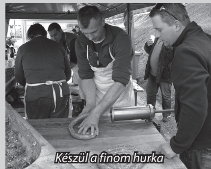
Készül a finom hurka

nak olyanok, akik maguk még soha nem láttak disznóölést. Most volt alkalmuk belekóstolni a disznótör hangulatába, amire Harsányban a helyiek vendégszeretete tette tette fel a koronát. „Ezúton szeretném megköszönni a képviselő-testület