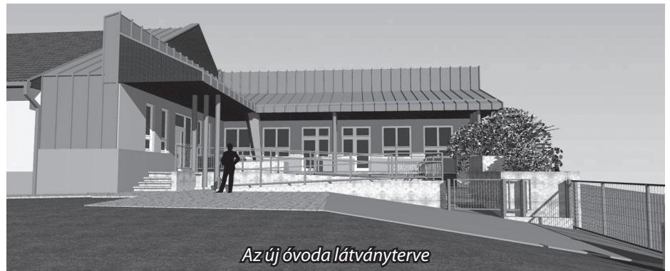
Az új óvoda látványterve

létre a Napköziotthonos Óvodában. Ez azt jelenti, hogy nyertes pályázat esetében 2 csoportszobával bővülne az intézmény, amelyet a mostani óvodához kívánunk hozzáépíteni. A projektben az építés mellett eszközbeszerzés és eszközfejlesztés is szerepel, amely révén a majdani csoportszobák berendezése, valamint a meglévő helyiségek bútorainak, játékainak, illetve a kültéri játékoknak a cseréje is megvalósul. Már nyertes pályázat az iskola energetikai fejlesztése,