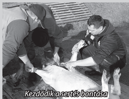
Kezdődik a sertés bontása

A település Önkormányzata által tavaly elkezdett gazdálkodási tevékenység eredményeként a közelmúltban levágták az első, az önkormányzati sertéstelepen felnevelkedett hízókat. Ehhez kapcsolódva rendezték meg az első Falusi Látványdisznótört, ahol mindenki megtekinthette a hagyományos falu-