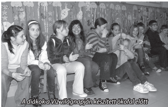
A diákok a Víz világnapján készített ökofal előtt