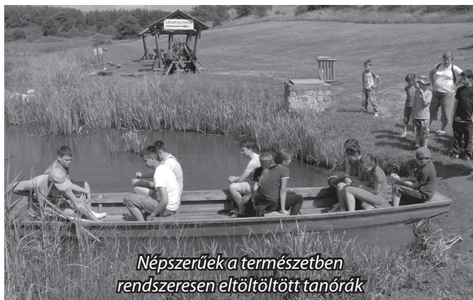
Népszerűek a természetben rendszeresen eltöltött tanórák

Szeptembertől a tervek szerint tovább bővül az oktatási paletta, hiszen újabb elemek bevezetésén dolgoznak az országban elsők között. A Köznevelési Törvény iránymutatásain alapuló, mintaprojektként bevezetendő módszer lényege, hogy az alsó tagozatos gyermekeknek játékos formában a népzene, a néptánc és a néprajz segítségével erősítsék a nemzeti identitástudatot és a hagyományok tiszteletét.